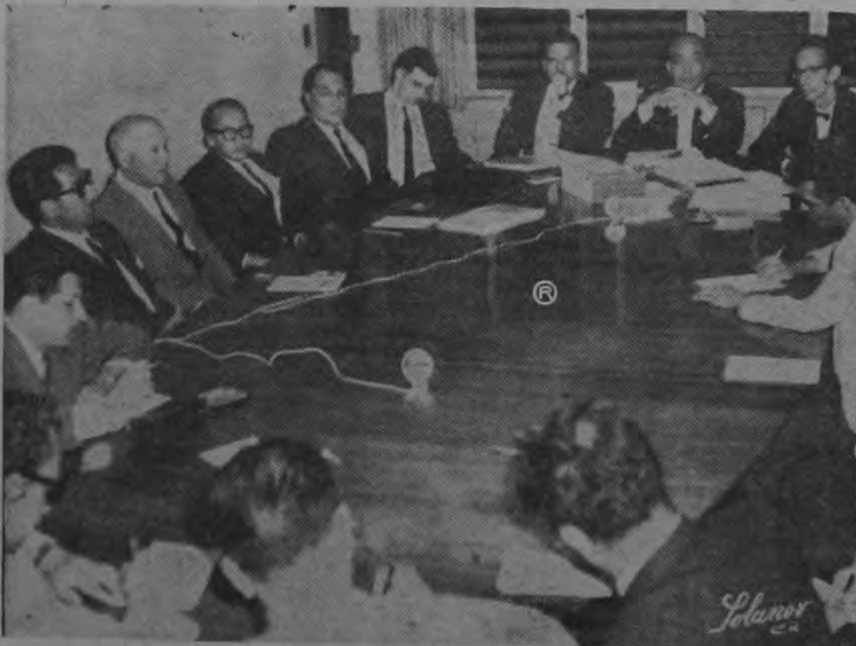
MESA REDONDA. Anoche en la sala de sesiones del SNAA se efectuó la reunión convocada por los señores directores de ese Instituto. Asistieron representantes de la prensa, radio y televisión. Se debatió ampliamente sobre el alza de

La Junta de Defensa del Tabaco ha hecho algunos experimentos en la siembra de tabaco para puros y pedirá al Banco Interamericano de Desarrollo un técnico en tabaco para saber qué posibilidades hay de poder sembrar los tres tipos que se requieren para fabricar los puros de los cuales Estados Unidos importa más de treinta y cinco millones de libras anuales. —(TEXTO EN PAGINA 12) —