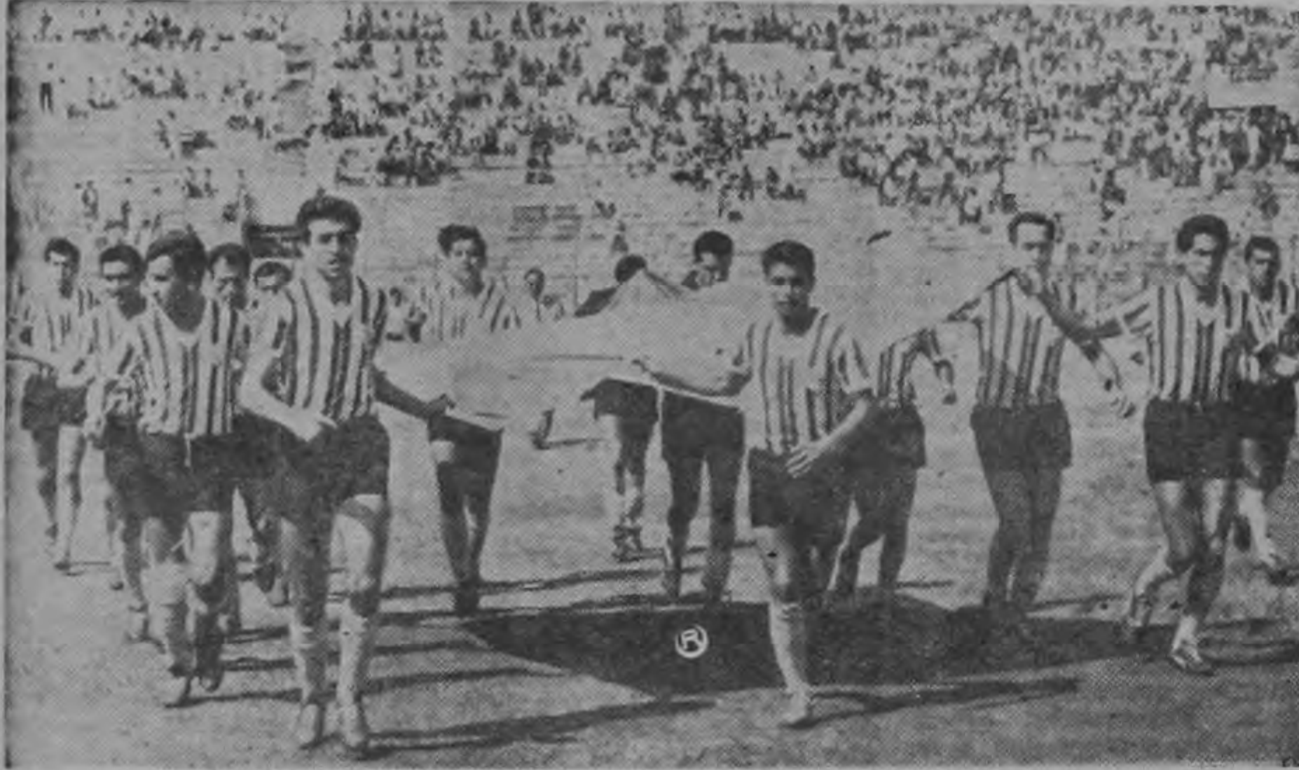
Estos son los rivales del Deportivo Saprissa para hoy en la noche. El Poza Rica de México es un conjunto que juega parecido al Oro. Estatura muy pareja en todas sus líneas y con un coraje grande. Los morados tendrán un difícil partido en la cuadrangular chapina esta noche.