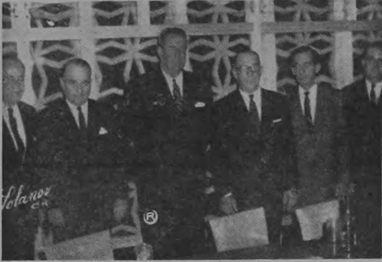
EL PRESIDENTE DE LA REPUBLICA asistió a un ágape al que fue especialmente invitado por los altos funcionarios de PAA en el Tennis Club anoche. Se ha informado que el motivo de este viaje es incrementar más fuertemente el turismo entre los Estados Unidos y América Central. A este fin han entrado en conversaciones con el ICT, varios de cuyos miembros asistieron al ágape en el Tennis Club. Se informó además que es interés de los altos funcionarios enterar de sus planes al Gobierno de Costa Rica.